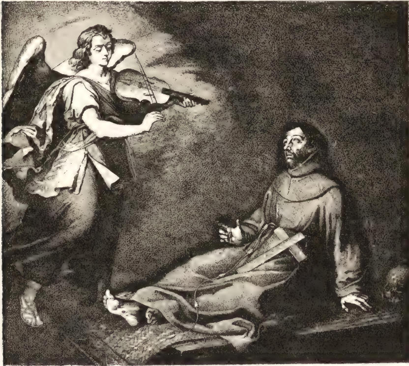
EXTASE DE SAINT FRANÇOIS.

médallions où sont dessinés les façades et les plans successifs de la vieille basilique, ces deux toiles, cintrées du haut, parce qu'elles occupaient autrefois des tympans, se présentent aujourd'hui, à cause des passe-partout dont les a dotés